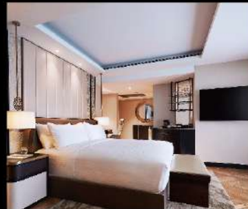
※写真とはイメージです